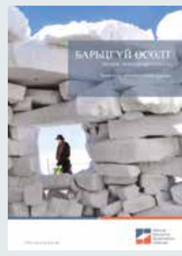
Зураг. Эрдэнэс Монголын хувь эзэмшил

Энэ хураангуйг Барьцгүй өсөлт: Эрдэнэс Монголын үнэлгээ тайланг үндэслэн бэлтгэсэн бөгөөд уг тайланг www.resourcegovernance.org/erdenes-mongol хаягаар авч болно