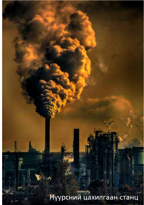
Нүүрсний цахилгаан станц

Нөгөө талаас, Эрдэнэс Монголын охин компаниуд нэг бол өөрийн гэсэн охин компани байгуулсан эсхүл бусад оролцогч талуудтай төрөл бүрийн хамтарсан компани болж гэрээ байгуулсан байдаг. Жишээлбэл, Мон-Атом компани ураны төсөл хэрэгжүүлэх дор хаяж гурван хамтарсан компанид хувь эзэмшиж байгаагаас Мон-Чех Ураны 51 хувь, Бадрах Энержигийн 34 хувь, Гурвансайханы 15 хувийг тус тус эзэмшдэг.